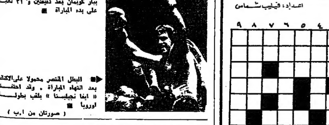
بطل اللعبة الاوروبي للسوز... بطل اللعبة الاوروبية للسوز...

في نطاق اعداد وتحضير منتخب لبنان للناشئين، يلعب يوم الاربعاء ٧ الجاري امام فريق الحكمة السادسة الثانية والستين على ارض ملعب برعد حور.